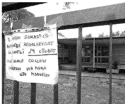
L'ingresso della scuola Manzi a Gagno