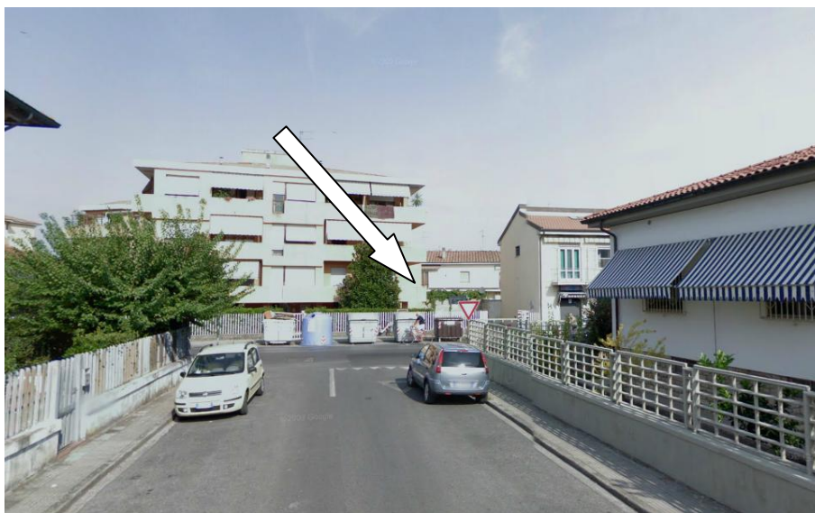
Incrocio Via Rosini - Via Garibaldi