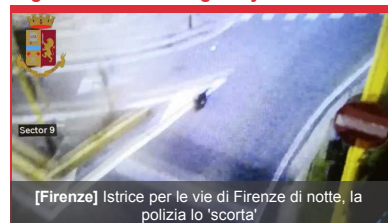
[Firenze] Istrice per le vie di Firenze di notte, la polizia lo 'scorta'

Per la tua Pubblicità su: #gonews.it 0571 700931 commerciale@xmediagroup.it