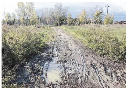
Oggi i sentieri si presentano così