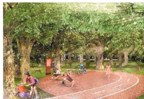
La simulazione grafica del nuovo parco