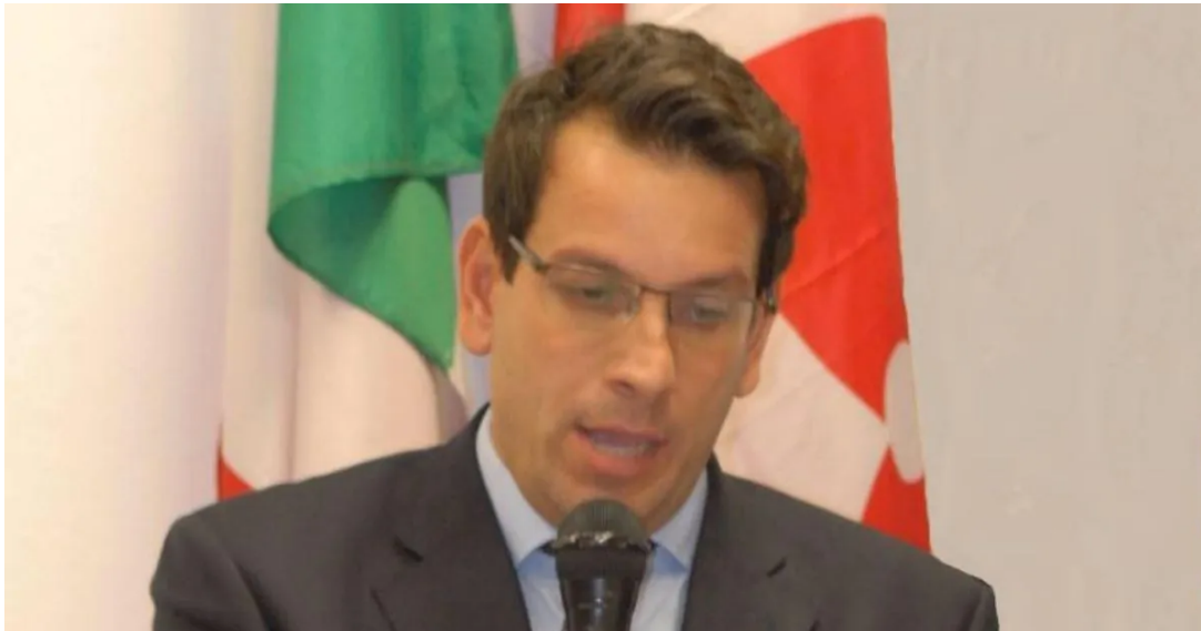
Raffaele Latrofa, assessore ai lavori pubblici di Fratelli d'Italia.