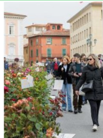
Piante in mostra

Sono in esposizioni, nel cuore della città, i prodotti di 160 vivaisti provenienti da tutta Italia